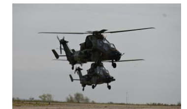
Cincu / Smardan

TIRS EN ESPACE CLOS – TIR MISSILE – TIR CANON CAESAR – TIR HELICOPTERE COMBAT BLINDE – FRANCHISSEMENT DE RIVIERE – MAINTENANCE RAVITAILLEMENT – APPUI MOBILITE TERRESTRE – COMBAT D'INFANTERIE - POSTE DE COMMANDEMENT BRIGADE