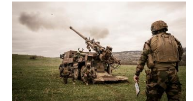
Cincu / Smardan