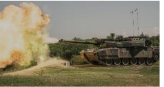
Cincu / Smardan