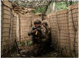
Cincu / Topraisar