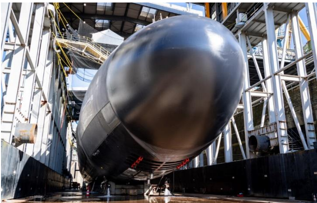
Un SNLE au bassin 8

Après 18 mois de travaux intensifs au bassin 8 de la base navale de Brest, le sous-marin nucléaire lanceur d'engins (SNLE) Le Vigilant a quitté le 18 juillet 2025 le port militaire de Brest pour rejoindre sa base opérationnelle d'attache à l'Île Longue et y effectuer sa dernière phase de son indisponibilité périodique pour entretien et réparation (IPER). Un chantier majeur et d'envergure qui a représenté 4 millions d'heures de travail, mobilisé 45 sociétés et plus de 1 000 personnes.