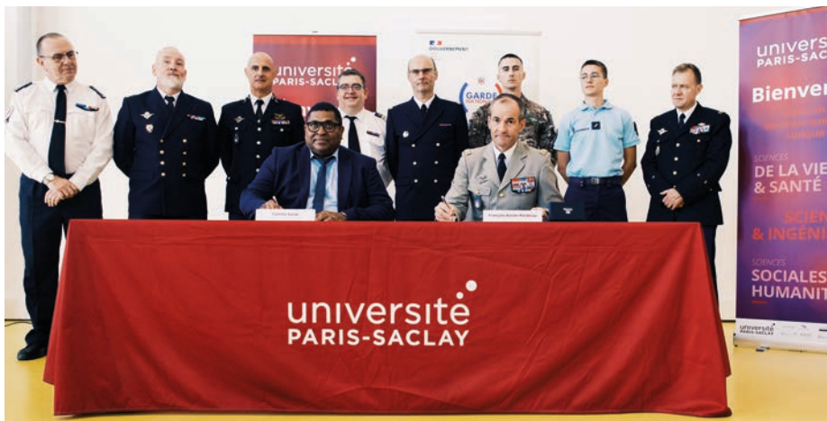
Signature de la convention entre la Garde nationale et l'université de Paris-Saclay