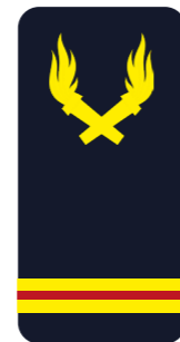
Agent technique en chef Adjudant-chef (ADC/ATC/AGTC) « Mon adjudant-chef »