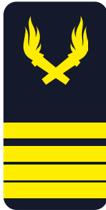
Ingénieur principal Commandant (CDT/IP) « Mon commandant »