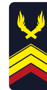
Brigadier-chef (BC1) CFT2 + 10 ans de service « Brigadier-chef »