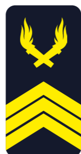
Maréchal des logis chef (MCH) « Chef »