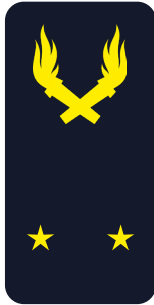
Ingénieur général de 2 e classe Général de brigade « Mon général »