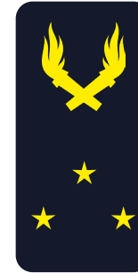
Ingénieur général de 1 ère classe Général de division « Mon général »