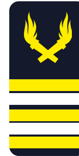
Ingénieur en chef de 2 nd e classe Lieutenant-colonel (LCL, IC2) « Mon colonel »