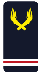
Agent technique Adjudant (ADJ/AT/AGT) « Mon adjudant »