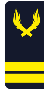
Lieutenant « Mon lieutenant » LTN