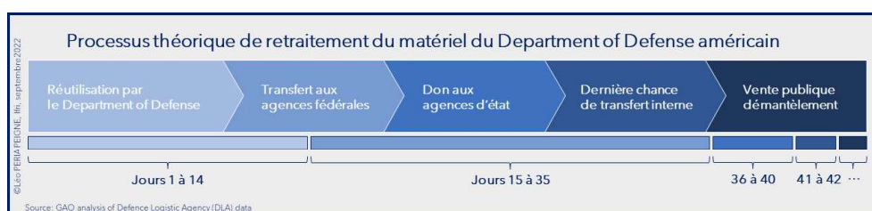
Schéma n° 1 : Processus théorique de retraitement du matériel du DoD américain