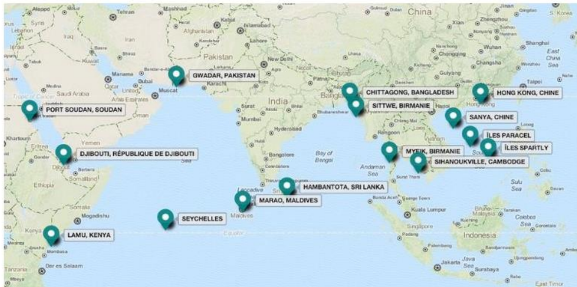
Les « perles » du « Collier » chinois.

Il apparaît par exemple que la stratégie du collier de perles entretient une filiation avec l’amiral Mahan, dont la pensée est intégrée et reprise par les stratèges militaires chinois. Prônant l’importance de la force navale pour se positionner en puissance globale, la force navale chinoise est, dans la stratégie du collier de perles, un moyen de répondre à de nombreux enjeux de puissance, qu’ils soient économiques, industriels ou diplomatiques. Garantissant la sécurisation des voies d’approvisionnement et des intérêts commerciaux, cette stratégie répond aux préconisations de Mahan appliquées aux intérêts chinois . Au-delà d’intérêts commerciaux et industriels, cette stratégie du collier de perles permet également à la Chine une expansion de son influence en établissant des liens diplomatiques avec plusieurs pays. L’établissement de bases navales à l’étranger, comme à Djibouti, au Pakistan, en Birmanie ou au Cambodge, a ainsi permis à la Chine d’établir et de renforcer ses liens avec d’autres pays sur la scène internationale 34 .