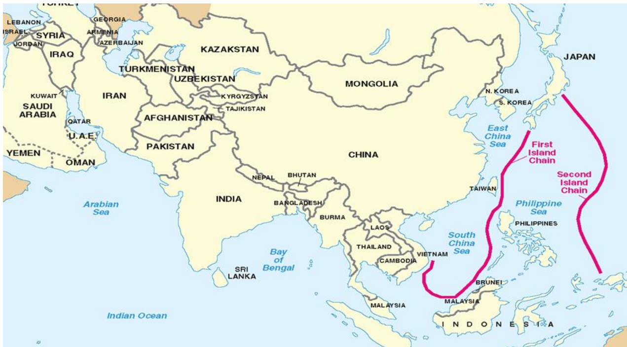
Première et deuxième chaînes d'îles chinoises