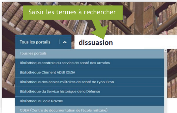
Page d'accueil de CLADE

Sélectionner CDEM dans le menu des portails