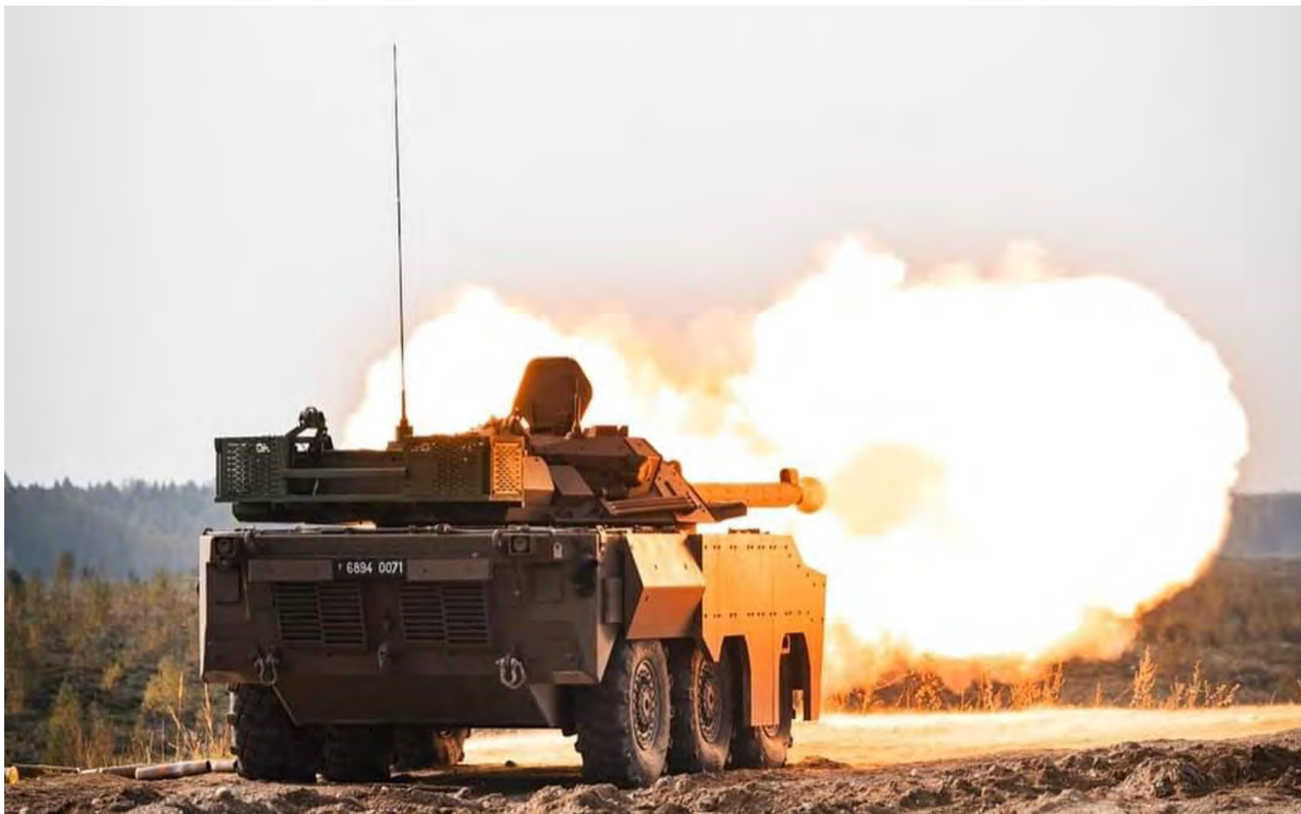
Les Spahis du 3 e escadron ont fêté l'anniversaire de la bataille d'Uskub en réalisant le premier tir d'AMX10RCR en Estonie.