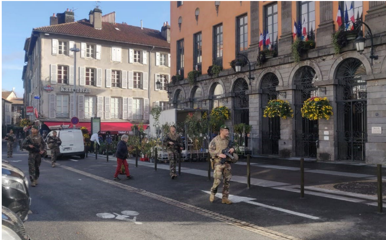
Patrouille Sentinelle dans le Puy-de-Dôme