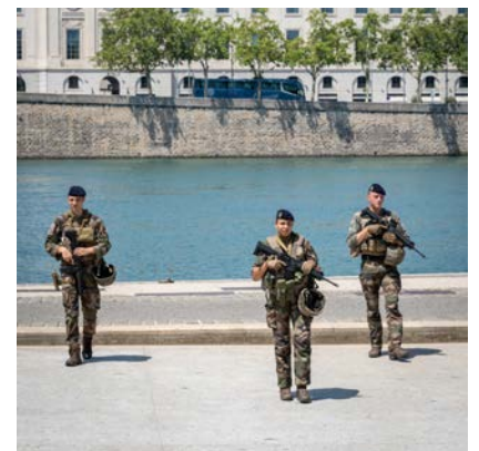
DOSSIER JOP24 : contribution des armées