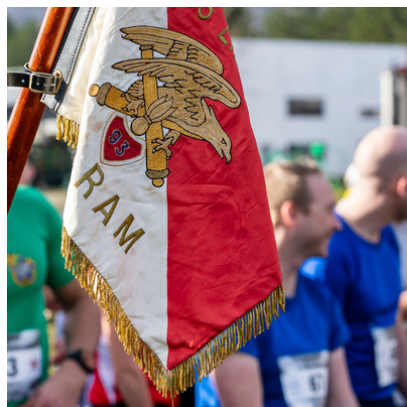
UNITÉ Challenge Terre Jeunesse