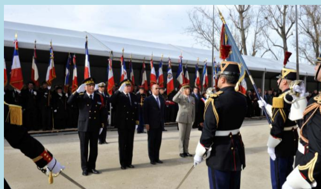
La cérémonie du quai Branly (19 mars)

Lors de son intervention, le ministre délégué a non seulement évoqué ces victimes mais aussi « tous ceux qui ont dû quitter leur terre natale, pour refaire leur vie dans un pays que, pour la plupart, ils ne connaissaient pas. »