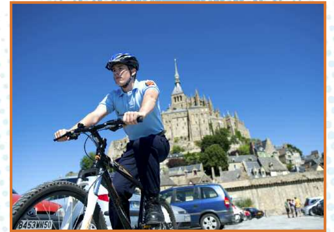
Les gendarmes réservistes patrouillent à vélo sur les aires de stationnement. Une présence bleue rassurante et dissuasive.

Peut-être y voient-ils également le flot humain des aoûtiens prêts à déferler sur la digue et à profiter, sous leur bonne garde, du Mont et de ses merveilles.