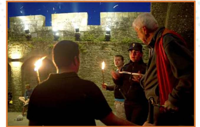
Sur le qui-vive de jour comme de nuit. Ici, lors de la retraite au flambeau vers l'abbaye.