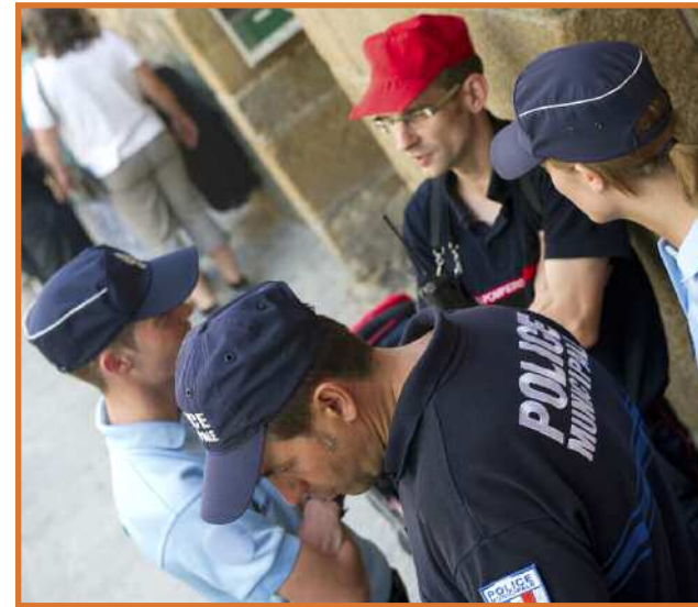
Échanges de renseignements, patrouilles communes : gendarmes, policiers municipaux et pompiers travaillent en parfaite symbiose.